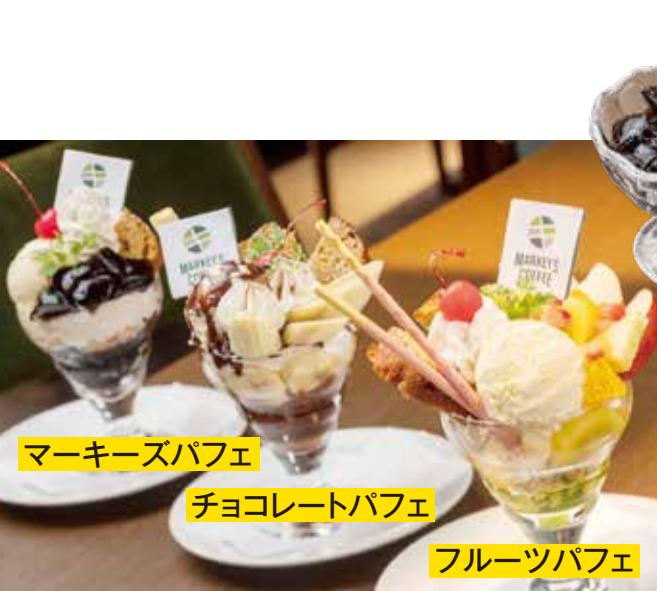
マーキーズパフェ