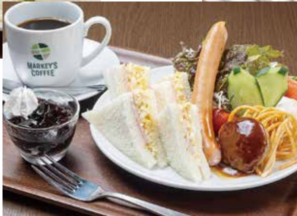
Bサンドウィッチモーニング