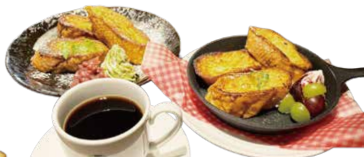
バケットフレンチ