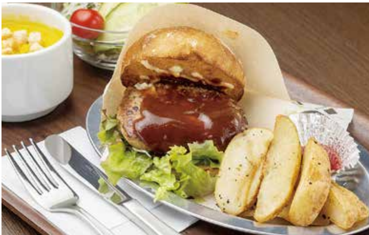
ハンバーガーセット