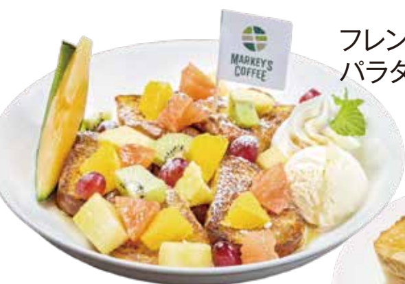
フレンチトースト パラダイス