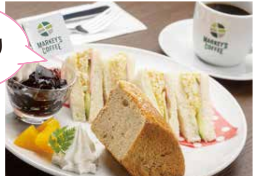
マーキーズの おやつ三種盛り ドリンクセット