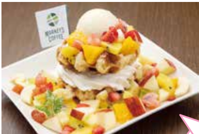
ワッフル ジュエリー