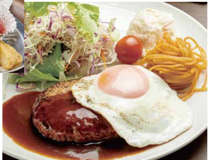
目玉焼きハンバーグ